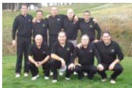
Can Rafel campions vigents de 1a Divisó