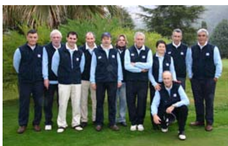
Sant Cebrià Blau